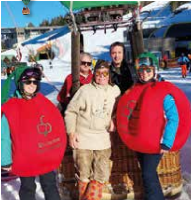
„Skifahrende Äpfel“ am Apfelballon