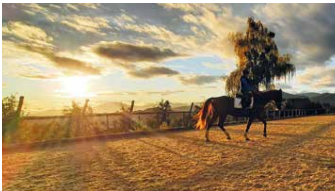
Das wohlige-warme Abendlicht verzaubert Pferd und Reiter gleichermaßen.

„Die schönste Zeit im Leben sind die kleinen Momente, in denen du spürst, du bist zur richtigen Zeit am richtigen Ort.“