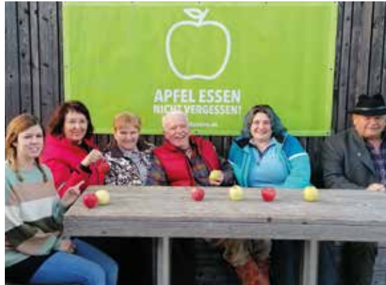
Auf der Planai gehört ein gesunder Apfel zum Ski-Vergnügen.