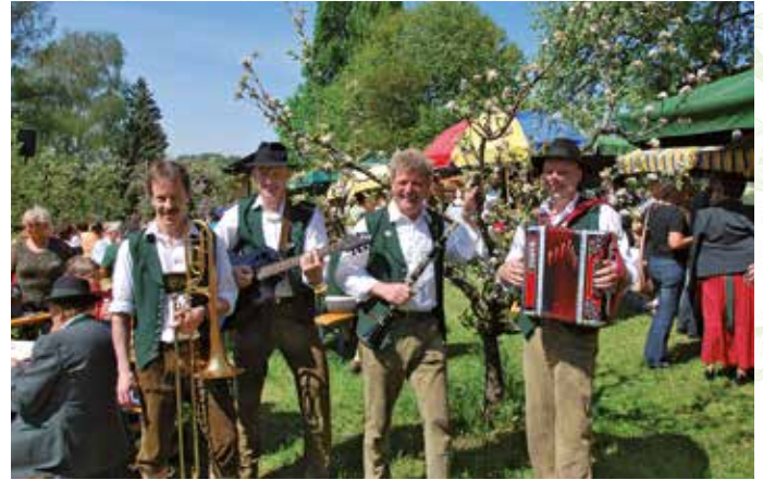
Zünftig aufg'spielt am Fest.

Auch heuer gibt es wieder zahlreiche schöne Preise bei der Blüten-Tombola zu gewinnen. Mit zwei verschiedenfarbigen Losen bist du auf alle Fälle schon unter den glücklichen Siegern, die mit einer Schachtel voll knackiger Äpfel nach Hause gehen. Viele weitere genussvolle und wertvolle Preise warten auf ihre Gewinner.