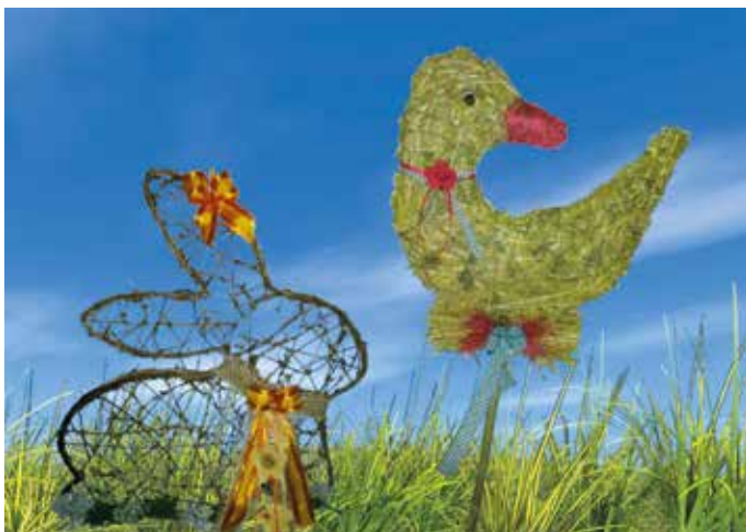
Österliche Bastelarbeiten und Frühlingschmuck für Haus und Garten.

Wenn es ringsum wieder zu blühen beginnt und die Tage länger und wärmer werden, gibt es wie alle Jahre wieder ab 2. März eine sehenswerte Osterausstellung bei uns am Hof. Frühlingschmuck für dein Haus und deinen Garten mit fantasievollen Basteleien aus Naturmaterialien erhältst du zu unseren Öffnungszeiten.