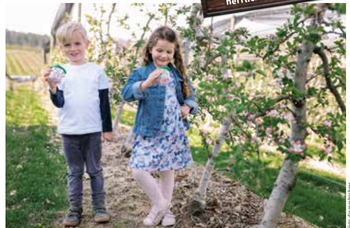
Auch für Kinder ist der Ausflug ins Blütenparadies ein tolles Erlebnis.