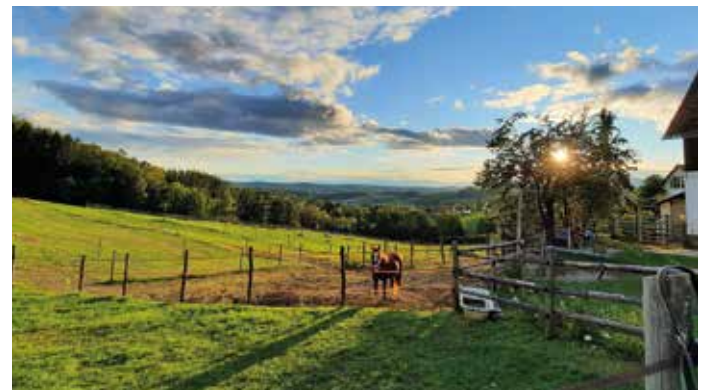
Unser Hof ist umgeben von saftigen Wiesen, nicht nur die Pferde lieben diese...

Ein Spruch, der wahrlich oft zu den Aussagen unserer Gäste passt, wenn man sie fragt „Was hat euch denn am allerbesten bei eurem Urlaub im Apfeldorf Puch bei uns am Bauernhof gefallen?“. Die kleinen berührenden Momente, wenn Kinder und Tiere miteinander kommunizieren, zu beobachten wie ein großes Pferd behutsam neben den Kleinen hergeht, der Hund das Frisbee besonders vorsichtig vor einem ängstlichen Kind ablegt oder die Kids einfach fröhlich der bunten Hühnerherde hinterher jagen, berühren besonders.