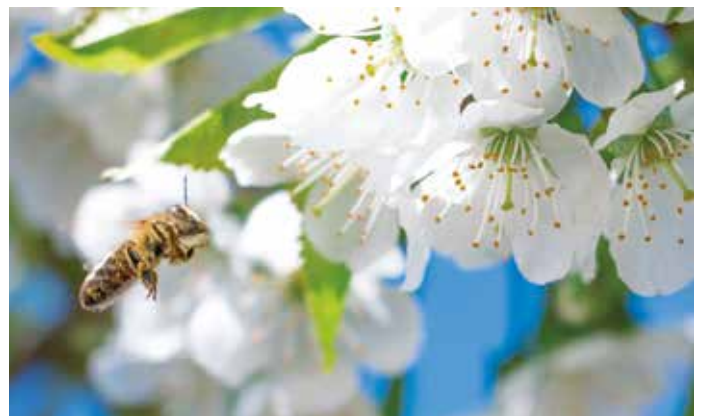
Im Frühling kommt Leben in die Blütenwelt von Höfler's Erlebnistag.

Wir freuen uns auf ein gemeinsames, blühendes Gartenjahr ...mit der einen Blüte mehr®!