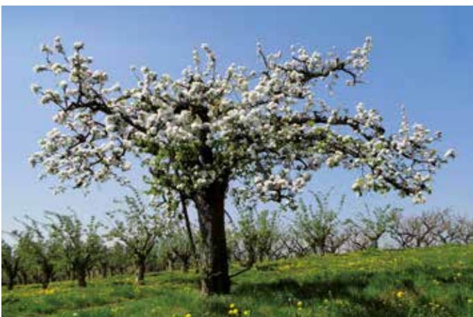
Paradiesisch. Die Blütezeit in ihrer ganzen duftenden Herrlichkeit erleben.