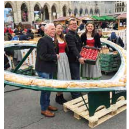
Apfelstrudelverkauf am Rathausplatz Wien

Z wei liebgewonnene Gelegenheiten, bei denen sich die Steirische Apfelstraße fern des Genuss-Paradieses Oststeiermark zeigt, aber nicht weniger genusslich: