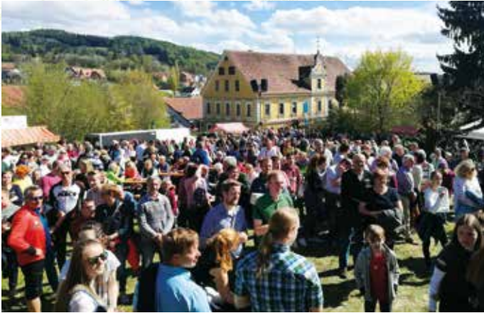
Beste Stimmung beim Blütenfest am Hochgartl mitten im Apfeldorf