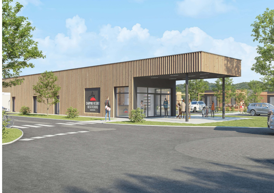
© Gebetsroither International GmbH - Rendering