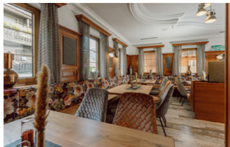
© Hotel Felsners / Höfleiner Christine