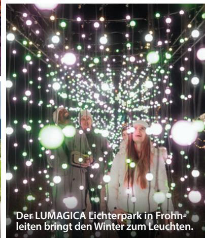
Der LUMAGICA Lichterpark in Frohnleiten bringt den Winter zum Leuchten.