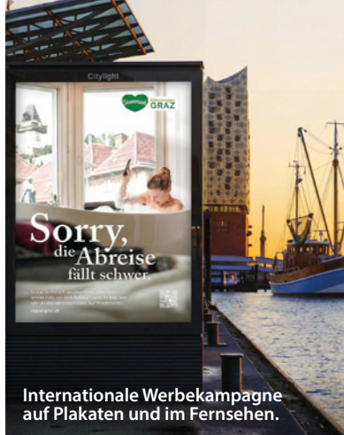
Internationale Werbekampagne auf Plakaten und im Fernsehen.

Kultur, Kulinarik oder Sport: Wir unterstützen etablierte Top-Events und fördern innovative neue Formate. Diese sorgen für zusätzliche Besucherströme und beleben die Region – gerade auch in der Nebensaison.