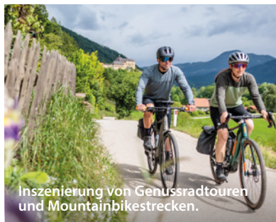
Inszenierung von Genussradtouren und Mountainbikestrecken.