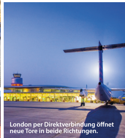
London per Direktverbindung öffnet neue Tore in beide Richtungen.