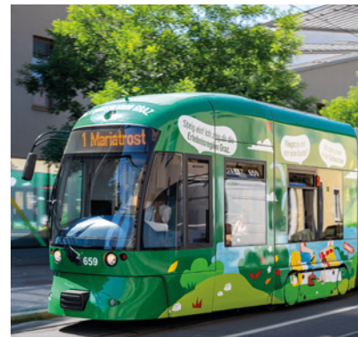
Positionierung im öffentlichen Raum zeigt unser Angebot am Heimatmarkt.