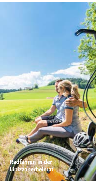
Radfahren in der Lipizzanerheimat