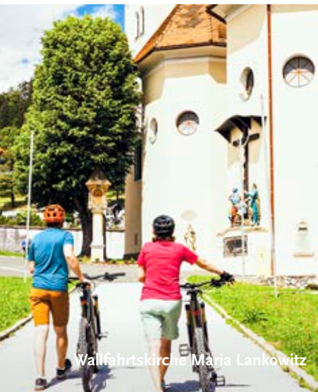
Wallfahrtskirche Maria Lankowitz

Anschluss an Graz über R9 und R14 (26 km / 67 hm ab Graz Süd, R2 Murradweg)