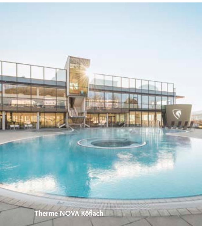
Thermo NOVA Köflach