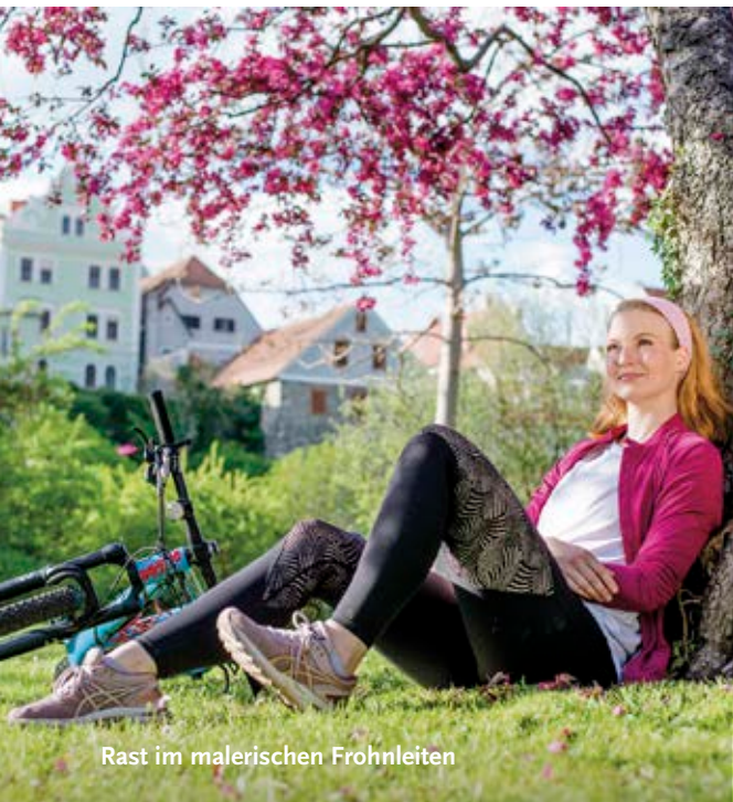
Rast im malerischen Frohnleiten