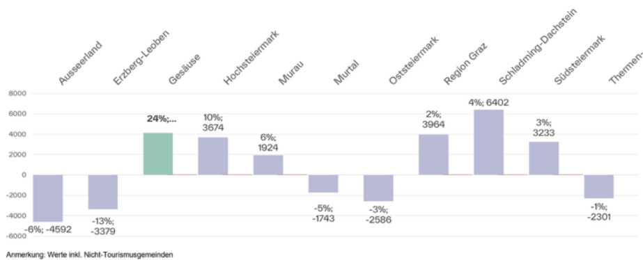
Veränderung Erlebnisregionen Steiermark Nächtigungen Okt 2024 vs Okt 2025